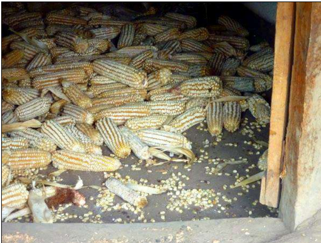
Misiones de evaluación de las culturas y de la seguridad alimentaria en el sur Sudan FAO/WFP – 2012

El 2 de marzo de 2012, durante una reunión de RESOGEST (Red de las estructuras públicas responsables de la gestión de los depósitos nacionales de seguridad alimentaria en el Sahel y África Occidental), diecisiete Estados de la región firmaron un marco de cooperación comprometiéndose especialmente a respetar los principios de libre circulación de los bienes en vigor en la región y a promover el comercio de cereales de los países excedentarios hacia los países deficitarios. Si estos acuerdos se aplican, beneficiarán en primer lugar a las personas que padecen el hambre.