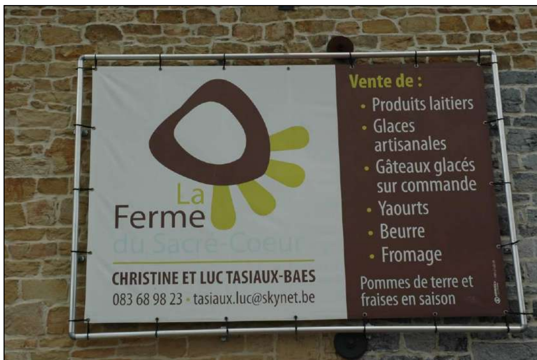
Diversificación – Granja 'du Sacré Coeur' visitada durante el seminario sobre las Inversiones Assesse (Bélgica) - abril de 2012