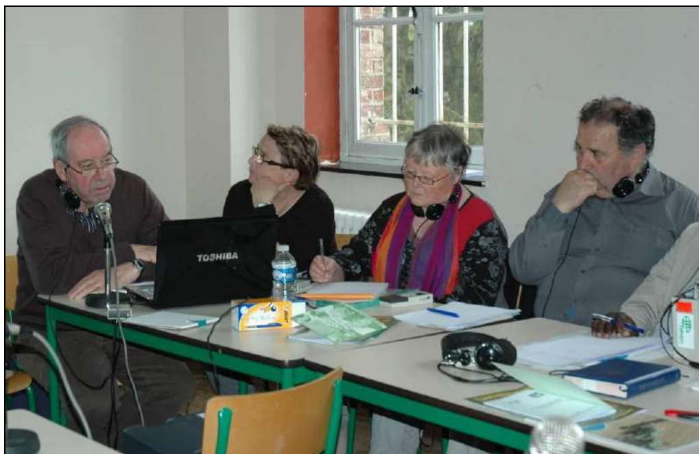
Intervención de los Miembros del Grupo de Trabajo de los Derechos humanos del FIMARC durante el seminario sobre las Inversiones - Assesse, abril de 2012