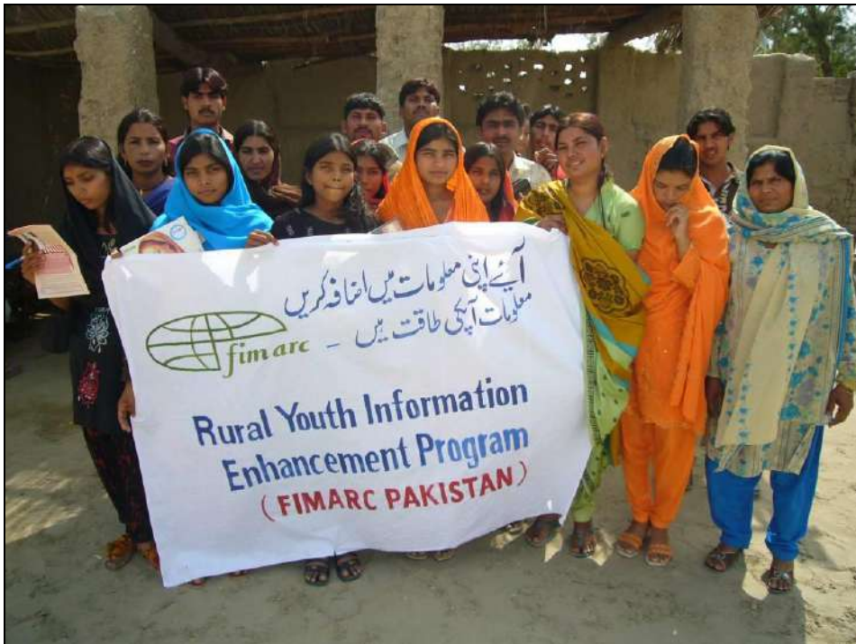
Programa de formación de las mujeres - Paquistán