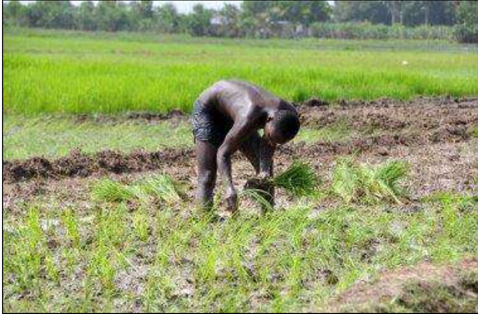
Misiones de evaluación de las culturas y de la seguridad alimentaria en Haití FAO/WFP – 2010