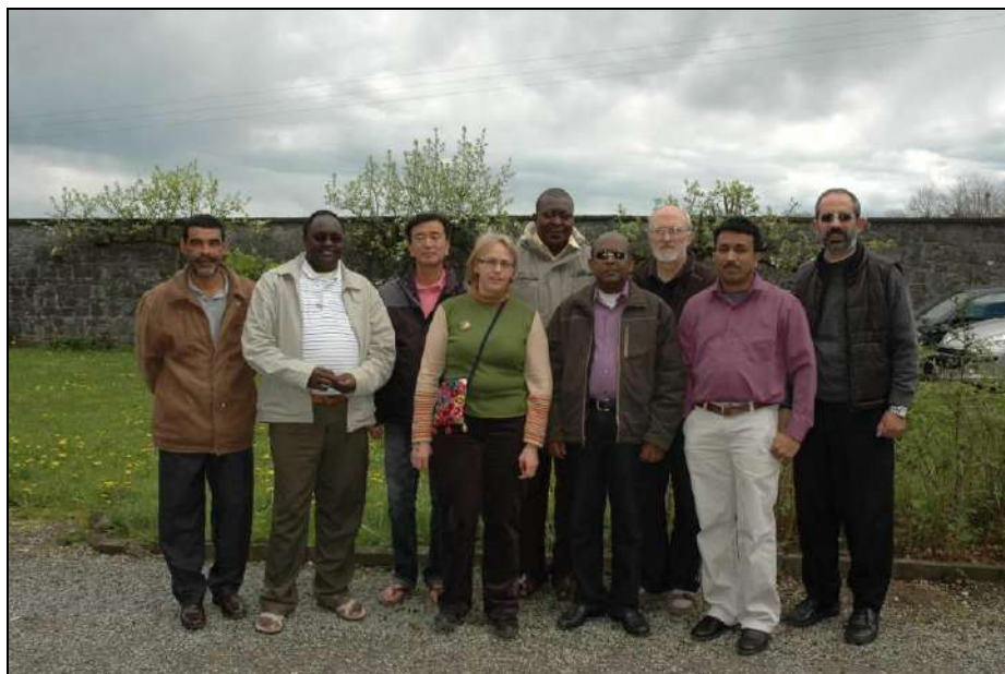
Los miembros del comité ejecutivo 2012/2014 de Fimarc Assesse, abril de 2012

(Declaración del Comité Ejecutivo de la FIMARC* - Assesse - Bélgica - 27 de abril de 2012).