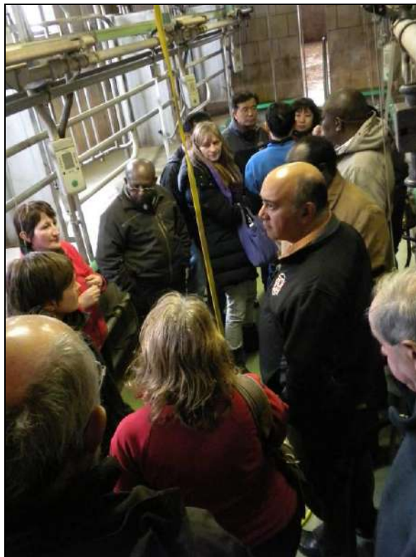
Los participantes al seminario sobre las Inversiones visitan la granja "de la Belle maison" – Emptinne (Bélgica) abril de 2012