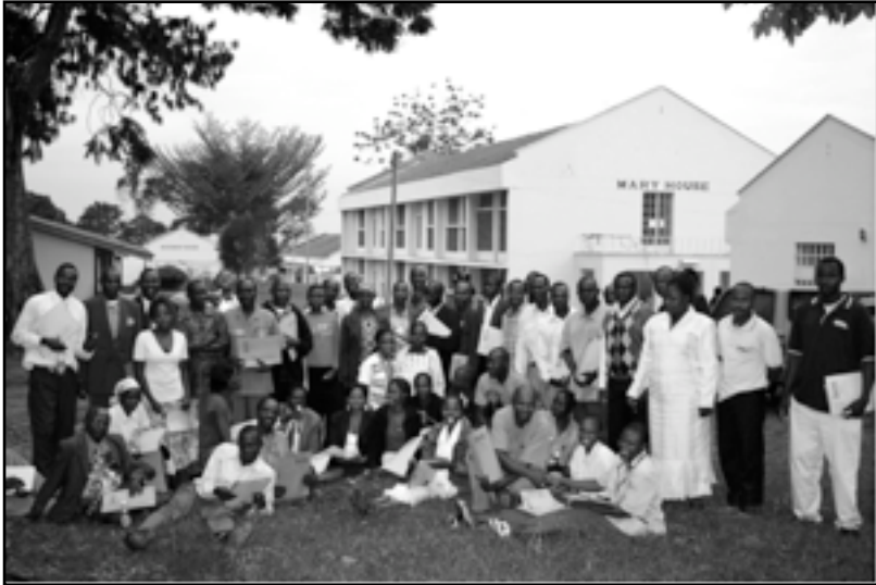
Los Participantes al taller residencial sobre la agricultura orgánica organizado por DECESE en el Centro ATC en Mabanga, Kenia 2013