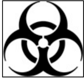
Símbolo internacional de contaminación biológica

Son incluso más fáciles de fabricar que las químicas o nucleares, y cuestan mucho menos. Cualquier país o grupo decidido a fabricar un agente biológico probablemente puede hacerlo con una mínima inversión e, incluso si la difusión de los agentes biológicos es difícil, algunos medios de diseminación se pueden obtener con bastante facilidad. Su uso está prohibido por una convención internacional desde 1925 y su desarrollo y su posesión, desde 1972.