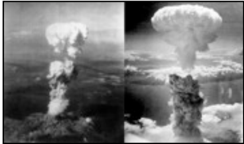
Hiroshima y Nagasaki -1945

Siendo sus efectos más destructivos y predecibles que los de las químicas y biológicas, las armas nucleares están consideradas más fiables y quizá más creíbles que las otras. También pueden sugerir una cierta idea de "prestigio", que se puede explicar por la proeza tecnológica que es el control de estas armas y el hecho de que se asocian exclusivamente a las grandes potencias.