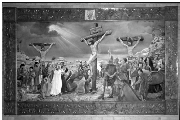
Pintura - Complejo Marianela, Atyra (Paraguay)