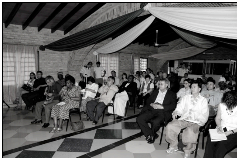
RM10 - Atyra, Paraguay