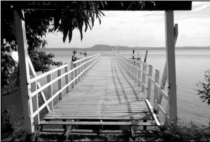
San Bernardino, Paraguay - Marzo de 2010

Como anunciamos en el numero precedente del VMR, retomamos en este VMR 98, el tema del Encuentro Mundial que será trabajado en el curso del plan de trabajo de 4 año, empezado en 2010 y que se terminara en 2014.