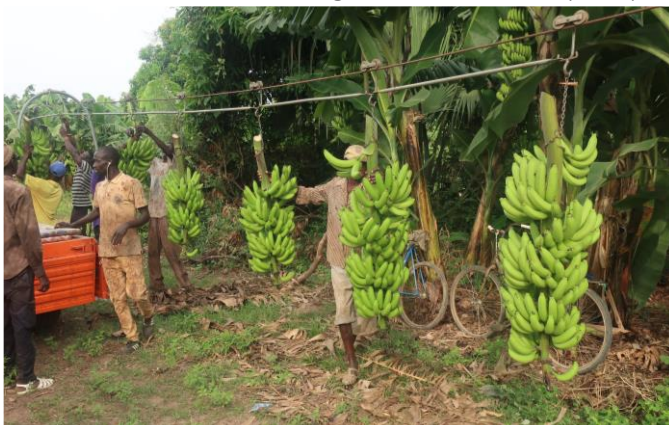
La inversión de los miembros de MARCS en la agricultura cooperativa: la producción de plátanos en Nguène (Tambacounda)