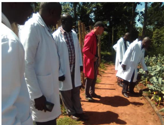
Visita de demostración en el terreno en relación con el establecimiento de plantones y la gestión de cultivos