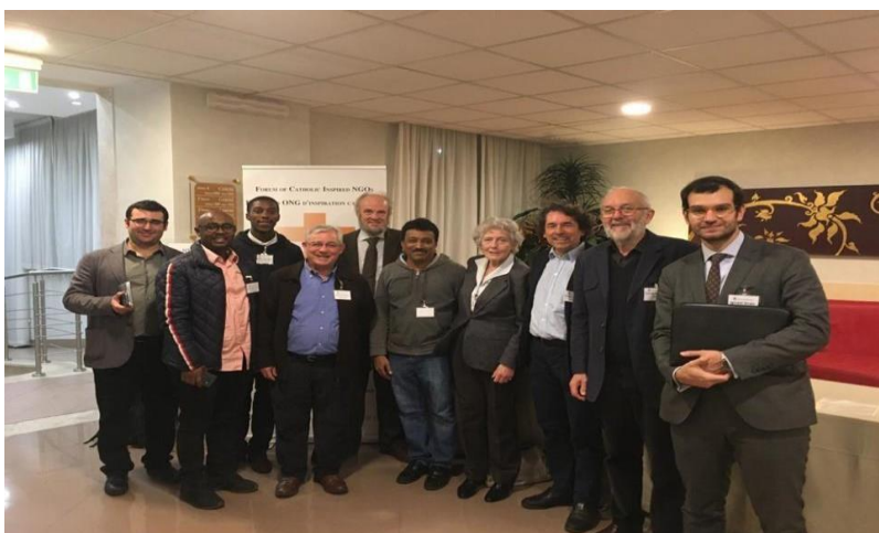
Algunos delegados de organizaciones de inspiración católica y el Secretario del Foro Vaticano