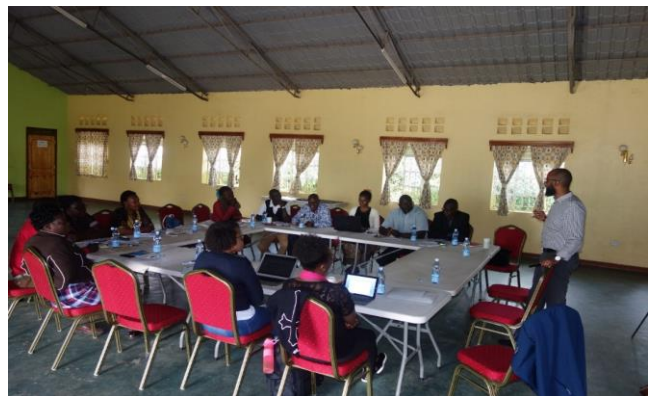
Reunión de creación de capacidad de la KRCS para debatir cuestiones de política y movilización de recursos