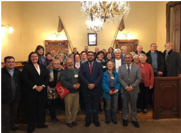
Los participantes en la reunión de Ávila