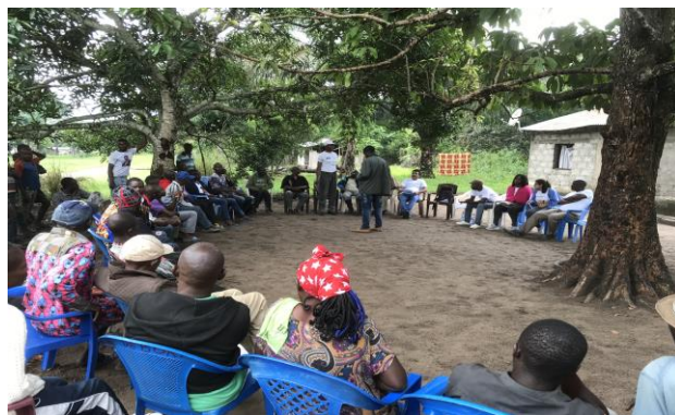
Las principales conclusiones y propuestas finales