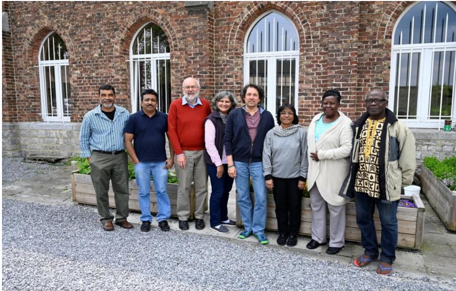
Los miembros del Consejo Ejecutivo de la FIMARC durante la reunion de 2019

Exco 2019 se celebró en Assesse (Bélgica), después de la sesión de capacitación sobre la transferencia intergeneracional de conocimientos en las zonas rurales. El Consejo Ejecutivo definió un plan de acción concreto del compromiso de la FIMARC de crear iniciativas para la transferencia de conocimientos en las zonas rurales a diferentes niveles, aprobó el trabajo y el informe financiero del movimiento, aportó contribuciones para el compromiso de la FIMARC al Consejo de Derechos Humanos, la FAO, el CFS, la UNESCO y también aprobó la resolución sobre la transferencia intergeneracional de conocimientos. Evaluó el trabajo de los movimientos continentales, elaboró los planes operativos del movimiento en diferentes niveles y actualizó nuestras acciones de cabildeo y promoción