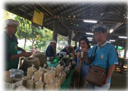
Visita final al mercado orgánico, Distrito Mae Heai, Chiang Mai