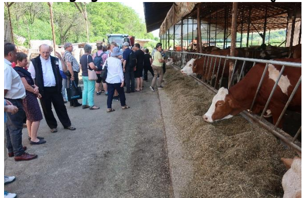
Cluj (Rumania): Comprensión de los mundos rurales de Europa oriental y occidental durante un seminario y una visita a una comunidad rural.