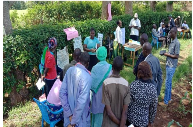
En una familia de agricultores orgánicos sostenibles que son miembros del grupo Boresha Matisi en Bungona West