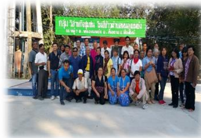
Visita al molino de arroz de la comunidad, aldea Nong yang, Chiang Mai