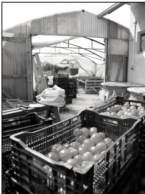
Explotación agrícola familiar - Croacia 2008