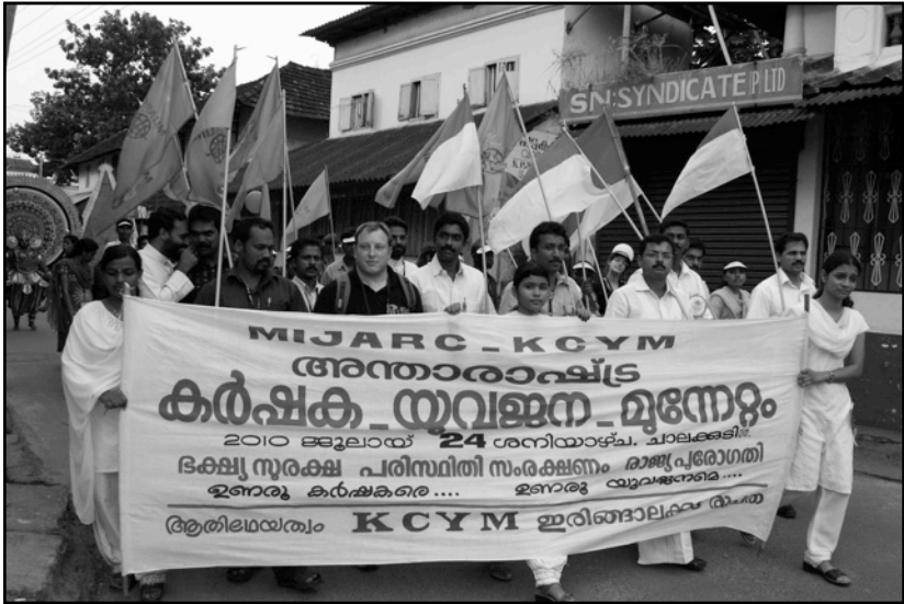
Manifestación organizada por el MIJARC y el KCYM durante el Simposio internacional sobre " El acaparamiento de las tierras y las amenazas para la biodiversidad "- Chalakkudi (Kerala / India) - Julio de 2010