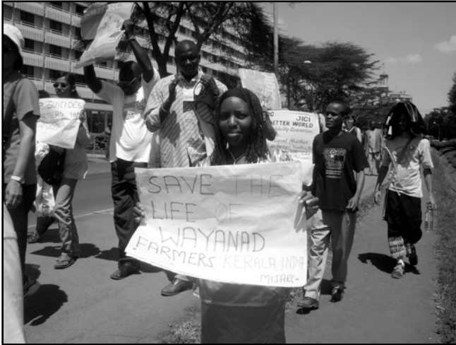
Marche de revendication pour la survie des paysans wayanad (Kerala, Inde) - FSM 2007 Kenya (MIJARC)