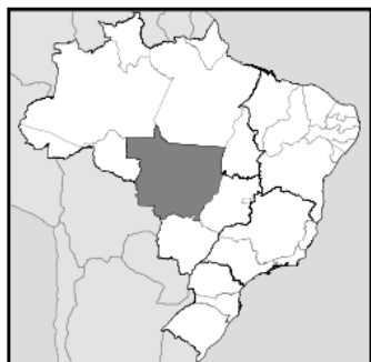
Mato Grosso - Brésil

En plus de fournir entièrement son marché intérieur, le Brésil est devenu le second exportateur de bioéthanol. Et c'est pourquoi les terres du Mato Grosso sont de plus en plus convoitées pour produire ce bioéthanol devenu très populaire. 65 % des nouveaux investissements en bioéthanol du pays se font dans cette région.