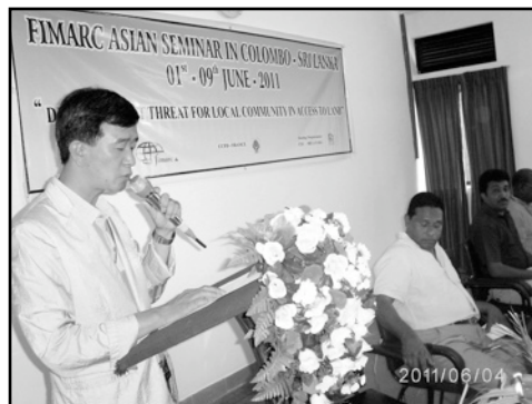
Séminaire Asiatique, Colombo (Sri Lanka)

Les mouvements membres de la FIMARC recevront prochainement un appel à l'action et nous vous demandons d'ores et déjà de vous préparer pour cette JMA.