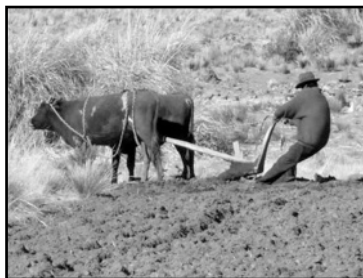
Bolivie (L. Tillieux)

En Bolivie, pour la population autochtone, la Terre Mère est omniprésente. Elle reçoit quotidiennement sa rasade d'alcool, sa part de grains de maïs, quelques cuillerées de soupe. Une foule d'offrandes que même — et surtout — les plus pauvres des pauvres n'oublient jamais de verser car «la Pachamama, c'est la vie», dit-on dans les Andes.